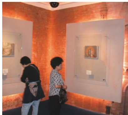
Il alto il modello della Cappella degli Scrovegni a Santiago del Cile Sopra tre immagini della mostra allestita a Taipei