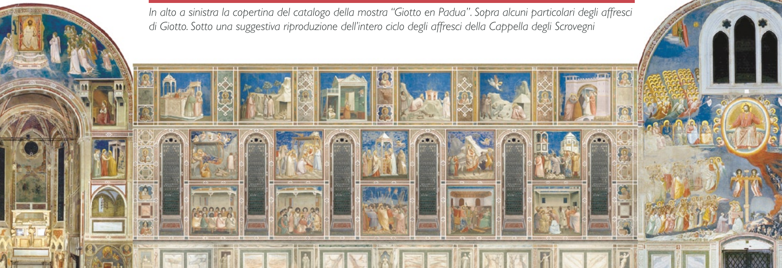
In alto a sinistra la copertina del catalogo della mostra "Giotto en Padua". Sopra alcuni particolari degli affreschi di Giotto. Sotto una suggestiva riproduzione dell'intero ciclo degli affreschi della Cappella degli Scrovegni