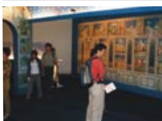
Sotto: alcune immagini della mostra Giotto's Message a Taipei, Cordoba e Mosca