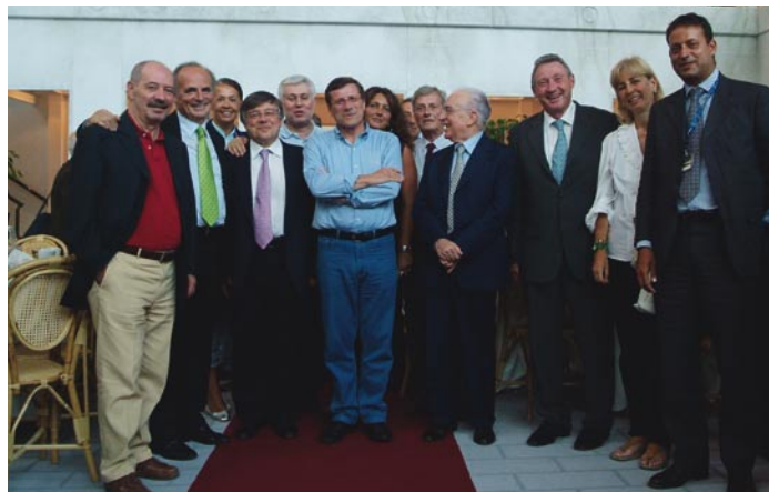
Sopra: foto di gruppo dei partecipanti alla presentazione del “Pedrocchi Concept” al 28° Meeting dei Popoli di Rimini.