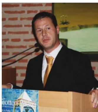
Sopra: l'Assessore alla Cultura della Provincia di Padova Massimo Giorgetti .